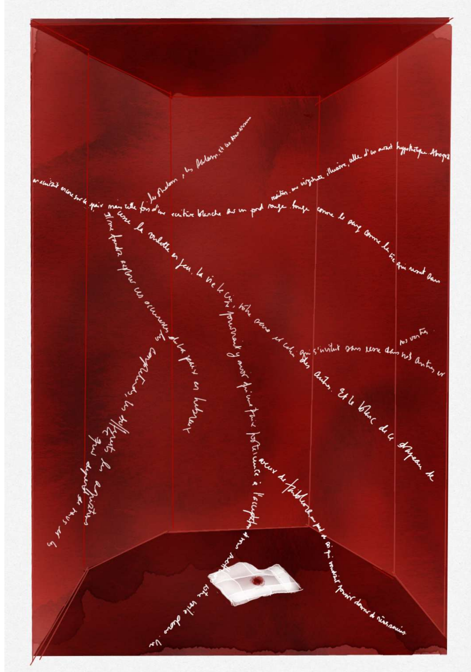
Nathalie Rodach, En paix (Caïn et Abel) , 2023

L'œuvre-livre est une création sensorielle, voulue comme un espace expérimental et libre. La présentation des Éditions Héros-Limite , fondées par Alain Berset , sera accompagnée d'une lecture d'un texte d' Alain Freudiger . Analix Forever semblera alors une vaste bibliothèque dans laquelle vous pourrez toucher, acheter ou recevoir, saisir, feuilleter et repartir avec des livres.