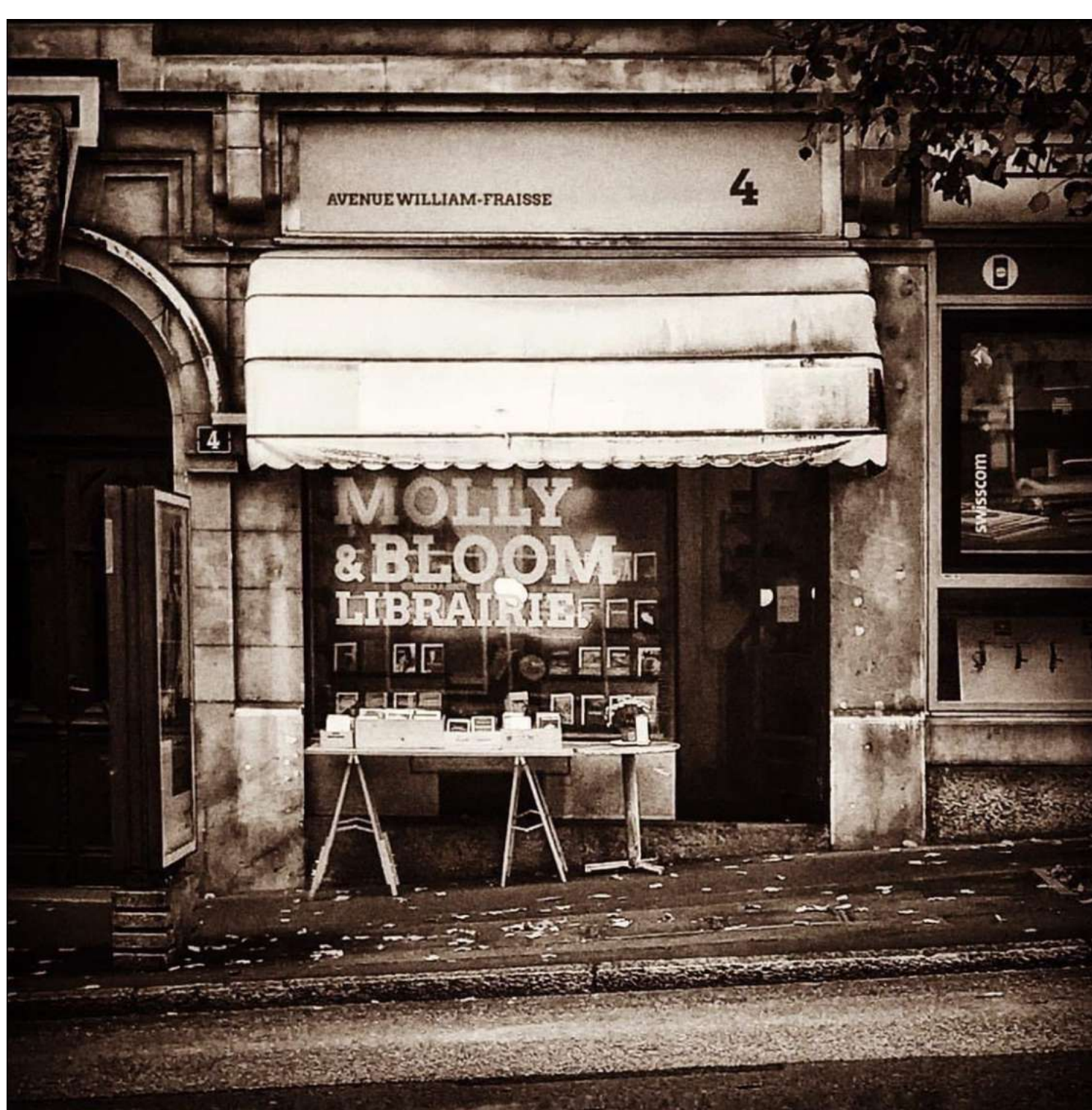
Molly&Bloom, Lausanne