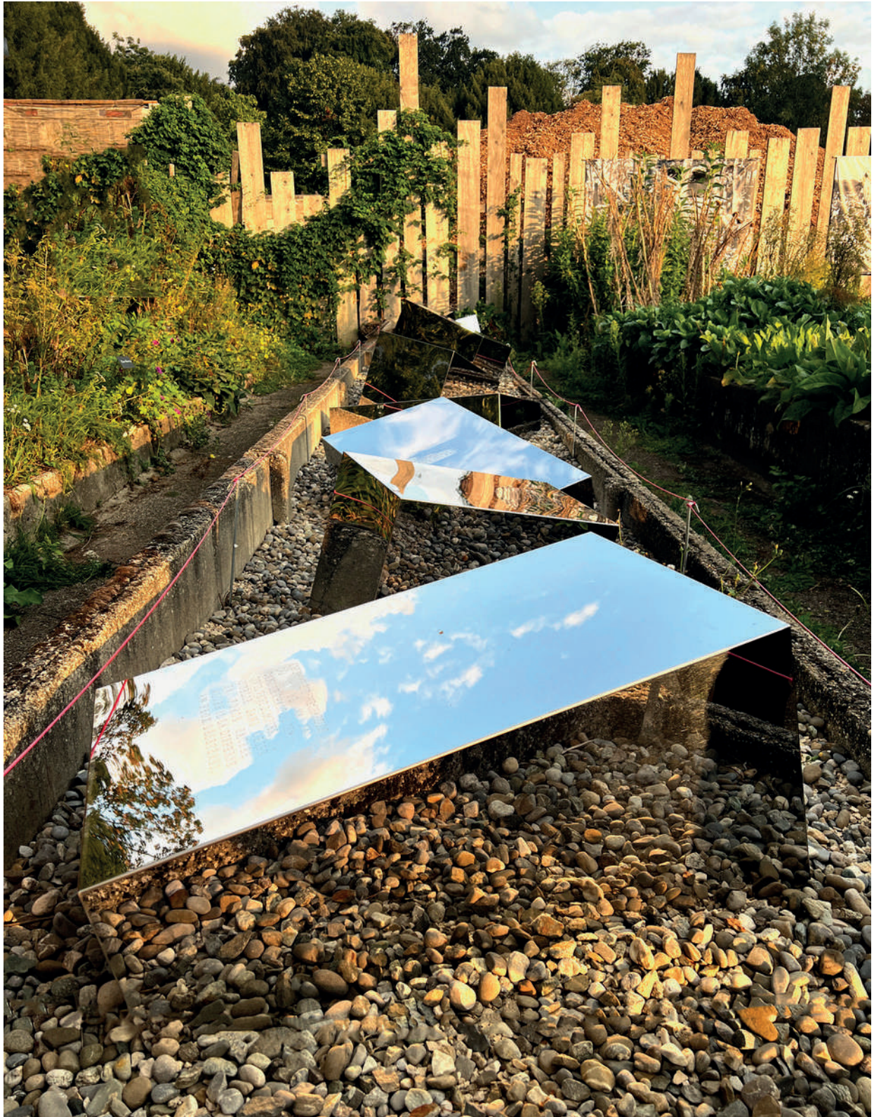
L'Homme est une chapelle - 2023 - Cimetière