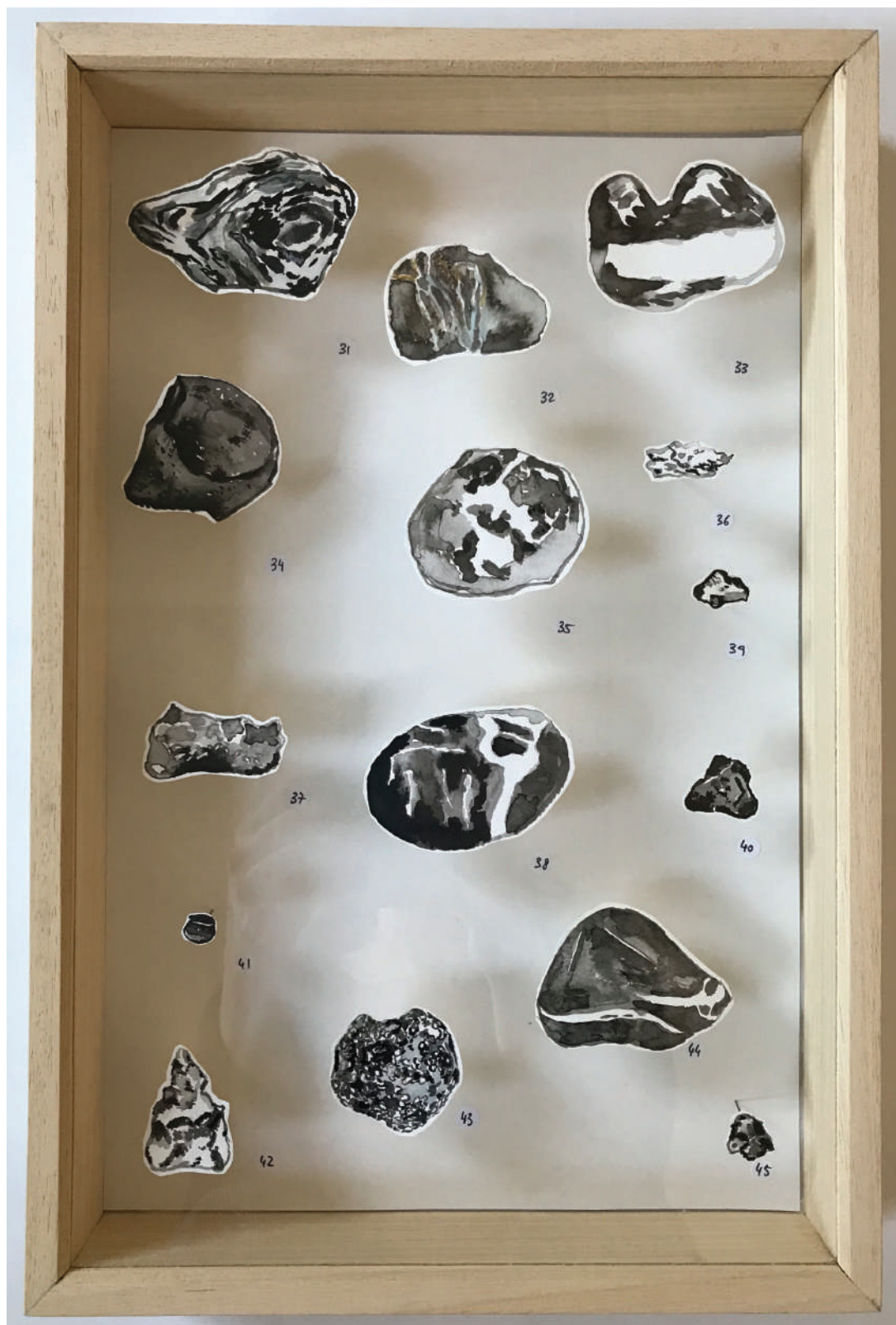
Semer des pierres , 2022, Lavis et aquarelle, 39 x 25,5 x 6 cm